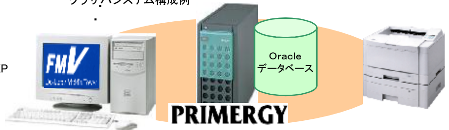
クラサバシステム構成例